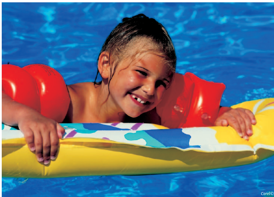
TBT in zwembandjes.

Dit werd nog eens bevestigd, doordat een fabrikant van sportartikelen in opspraak kwam door de aanwezigheid van tributyltin in sportshirts. Naar aanleiding van dit voorval heeft TNO in het kader van kwaliteitsbewaking een groot aantal sportartikelen voor fabrikanten onderzocht.