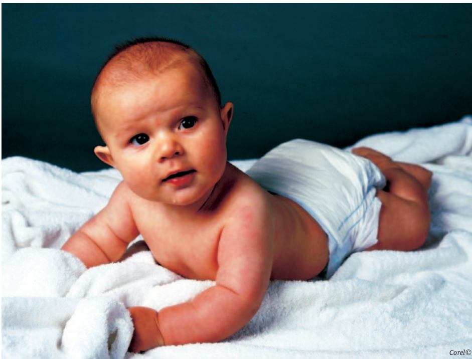
TBT in wegwerpluiers.

Regelmatig verschijnen in de media berichten dat consumentenproducten het giftige tributyltin (TBT) bevatten. Vanwege de toxiciteit van TBT dienen deze incidenten zeer serieus genomen te worden. TBT kan al in lage concentraties het immuun- en het hormoonstelsel beïnvloeden. Om inzichtelijk te maken in hoeverre uw producten TBT of andere organotinverbindingen bevatten, kan TNO uw producten snel en deskundig onderzoeken.