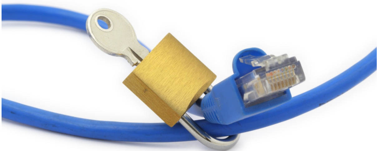
Figuur 1: Vercijferen van data

Zou het niet prettig zijn wanneer al die toepassingen je wel van nuttige informatie kunnen voorzien maar zonder dat ze al jouw persoonlijke informatie in handen krijgen? Voor de klanten is het een hele geruststelling om te weten dat hun privé gegevens nooit in vreemde handen zullen vallen, en de provider hoeft zich ook niet meer druk te maken of hij wel zorgvuldig genoeg is omgegaan met de persoonlijke gegevens van zijn klanten.